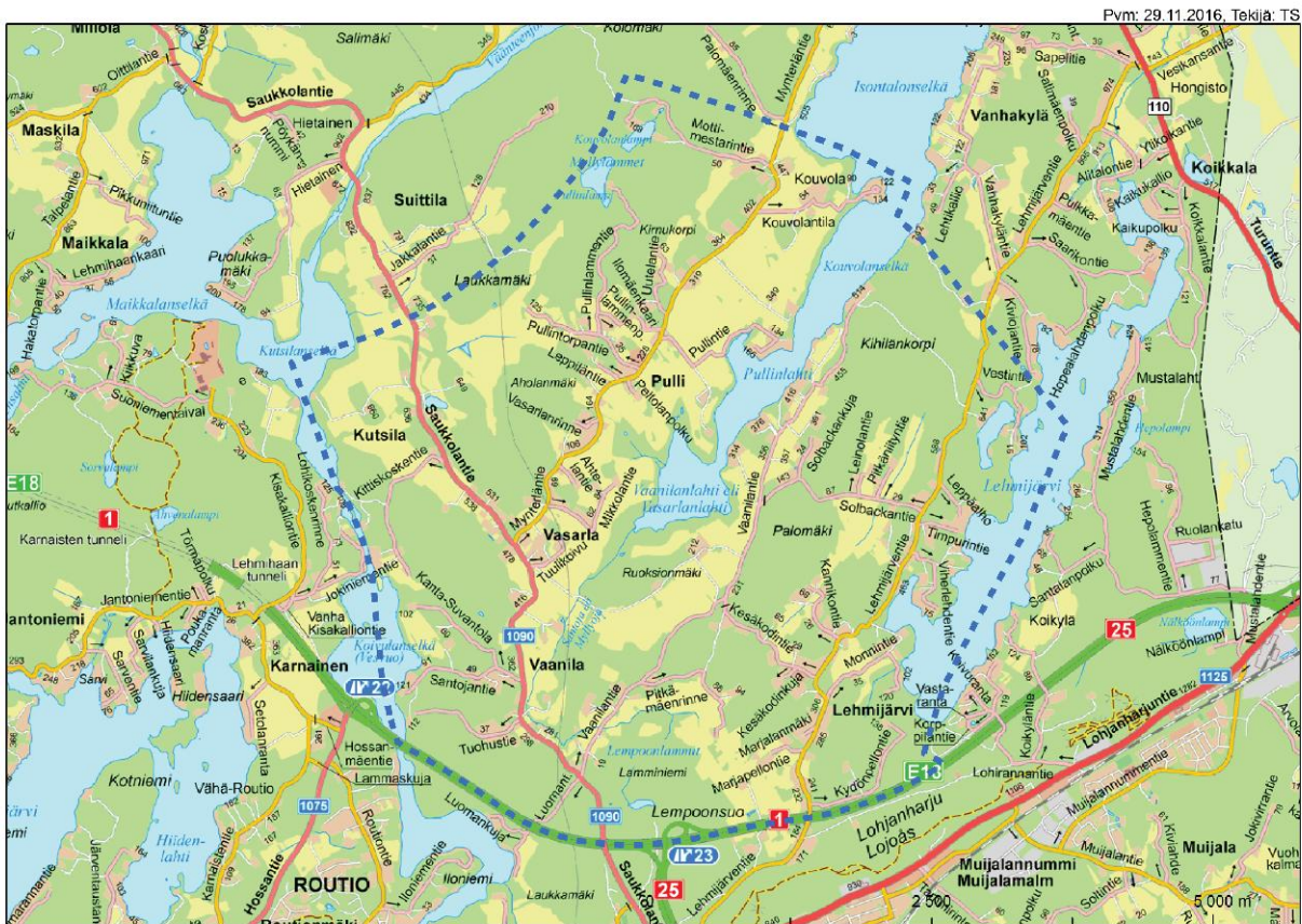
Kaava-alueen alustava, ohjeellinen rajaus opaskartalla

Kaava-alueen rajaus tarkentuu kaavoitusprosessin aikana.