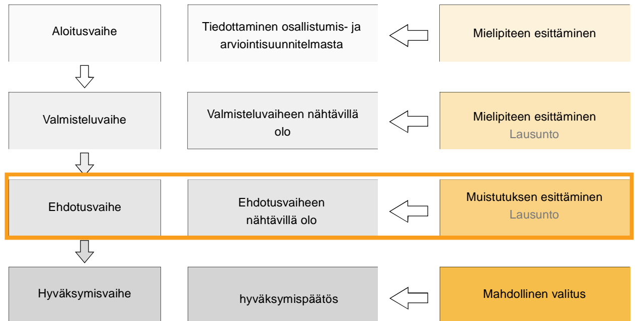
Kuva 2. Kaavoituksen kulku ja osallistumisen vaiheet.