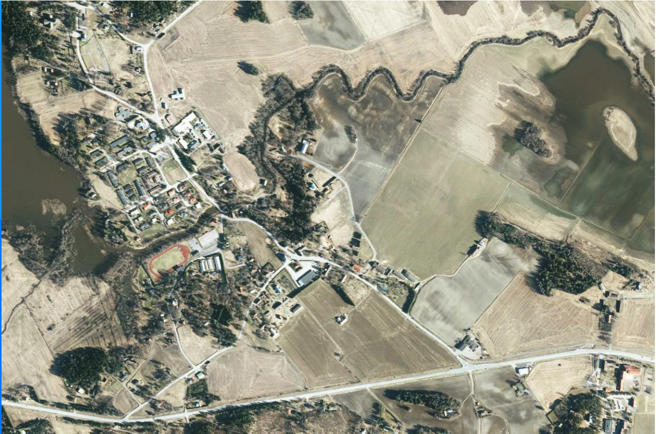
Lohjan kaupunki | Ympäristötoimi | Kaavoitus | TLE | 11.2.2016