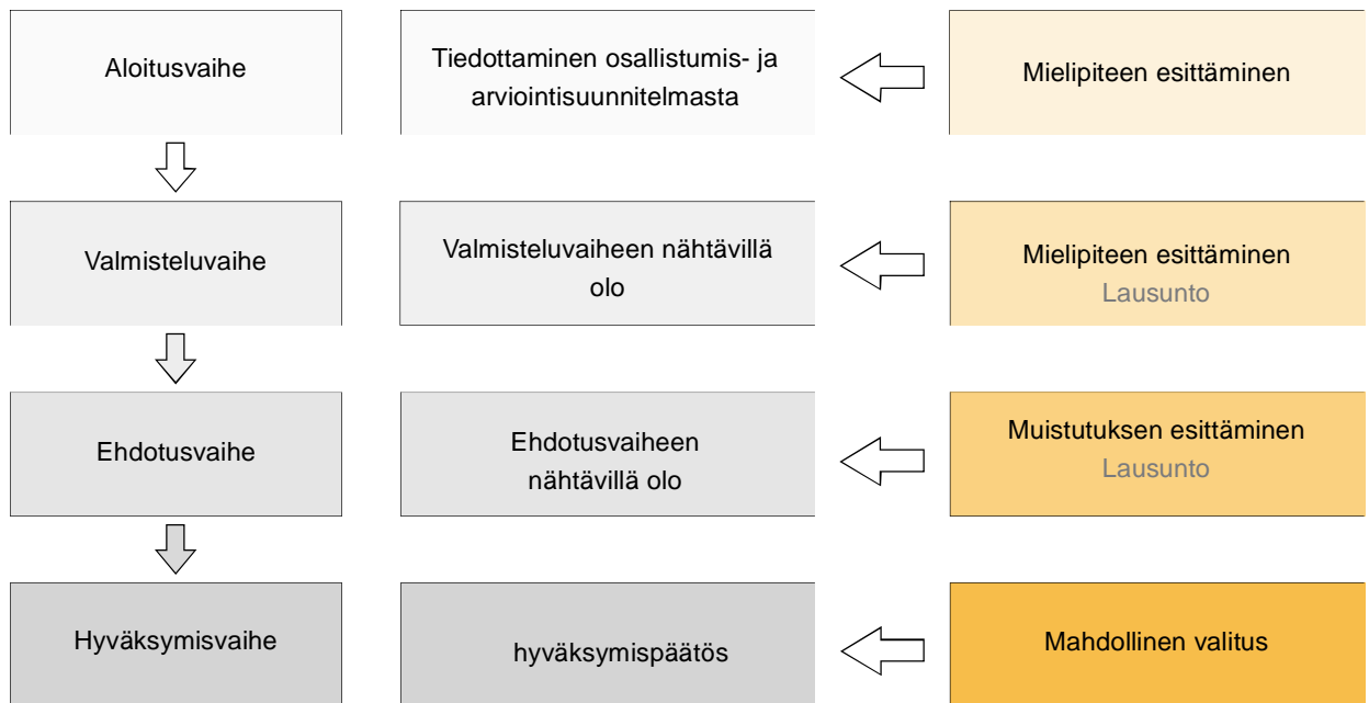
Kuva 2. Kaavoituksen kulku ja osallistumisen vaiheet.

Lohjan kaupunki Ympäristötoimi, kaavoitus